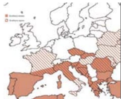
Verspreiding van Dirofilaria immitis en Dirofilaria repens in Europa.

Neemt u uw huisdier deze zomer gerust mee op vakantie. Maar ga er wel tijdig mee naar de dierenarts. Kijk voor veel meer extra informatie op www.sterkliniek.nl Op deze site kunt u de 20 pagina dikke beestachtig leuke vakantiefolder gratis downloaden met alle informatie die u nodig heeft als u met uw huisdier op vakantie gaat en tevens een zeer handige checklist.