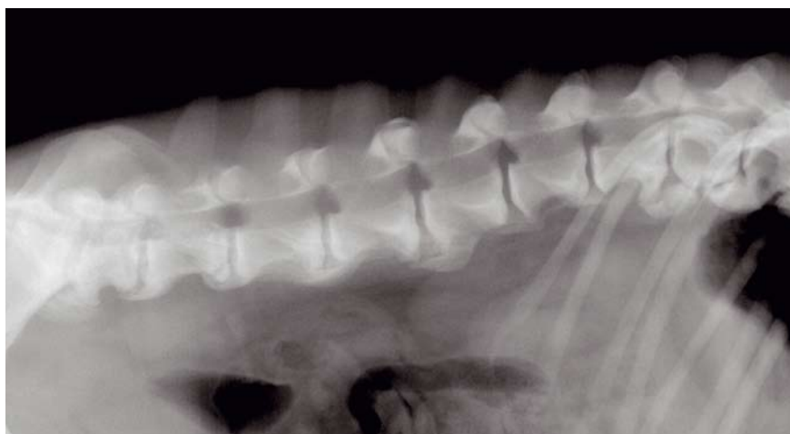
Röntgenfoto van de wervelkolom van de hond. De wervellichamen (rechthoekige blokjes) worden aan de onderzijde met elkaar verbonden door botvorming. Deze aandoening wordt spondylose genoemd.

Een bijzondere locatie is die bij de overgang van de laatste lendenwervel naar het staartbeen. Op deze plaats kunnen de botwoekeringen dusdanige vormen aannemen dat als gevolg hiervan er wel zenuwuitval optreedt. De klachten kunnen zo ernstig worden dat de hond geëuthanaseerd moet worden.